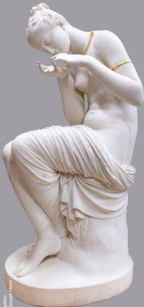
La jeune fille au papillon Lemaire Philippe Joseph Henri

Au cours du XVIII e siècle, tandis que les fêtes galantes perdent peu à peu leur place sur la scène française, plusieurs éléments participent à un renouvellement artistique influencé par l'Antiquité. La redécouverte de cette période, qu'elle soit lointaine ou régionale, accompagnée du développement des séjours des artistes en Italie ou en Grèce, vont redonner aux valeurs, aux thèmes et au style de l'Antiquité une place primordiale.